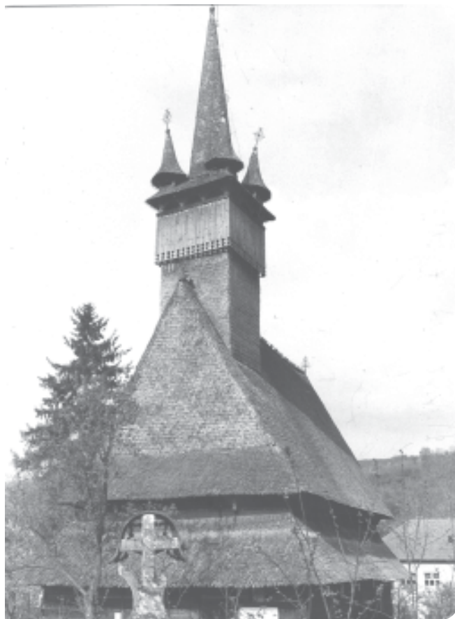
Turla de 73 de metri a bisericii din Surdești Maramureșului, construită la 1721

R. Co. R. 1997 distinsă cu ordinul MERITUL CULTURAL în grad de Mare Ofițer și cu ORDINUL ZIARIȘTILOR clasa I - aur M.P.S.R.