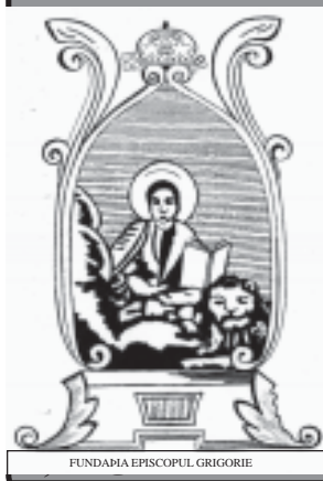
FUNDATIA EPISCOPUL GRIGORIE

După cucerirea latină a Bizanțului, la Vicina își vor găsi refugiu și adăpost numeroși greci, inclusiv episcopi. Unul dintre acești episcopi a fost și Iachint, care avea să-și găsească refugiu – din calea Genovezilor – la Curtea Domnitorului Țării Românești, adică la Curtea de Argeș, unde va deveni și primul ei mitropolit grec. Acesta a adus însă cu sine trecerea Bisericii Vlahilor sub jurisdicția canonică a Constantinopolului, în anul 1359. Acesta este într-adevăr anul când Biserica nord-dunăreană – obligată să se înscrie în calculele politice ale Țării – a fost și ea încorporată – odată cu Statul – în ael „Commonwealth” bizantin, pierzându-și de deabia atunci, după mai bine de un mileniu, autocefalia.