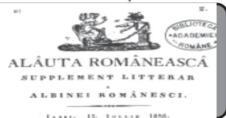
TABLE. 15. IULIE 1858.

ÎN PAGINA 11, SUPLIMENTUL LITERAR versuri de Paul Everac