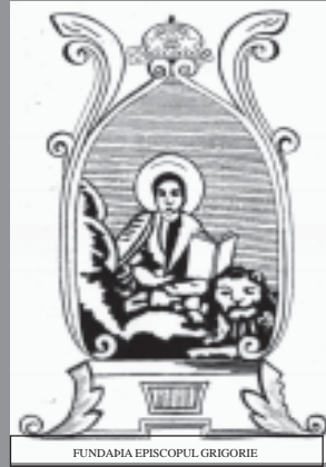
FUNDATIA EPISCOPUL GRIGORIE

FUNDATIA EPISCOPUL GRIGORIE LEU persoană juridică română de utilitate publică susține în continuare propunerea argumentată prin asemenea studii, ca Patriarhul României, care este și Mitropolit al Munteniei și Dobrogei, să fie de fapt și de drept Arhiepiscop al Tomisului. Se va sublinia astfel adevărul istoric al certei vechimi apostolice a episcopatului românesc pe locurile de naș tere ale poporului nostru etc, nesufragane, cu celelalte episcopii apostolice.